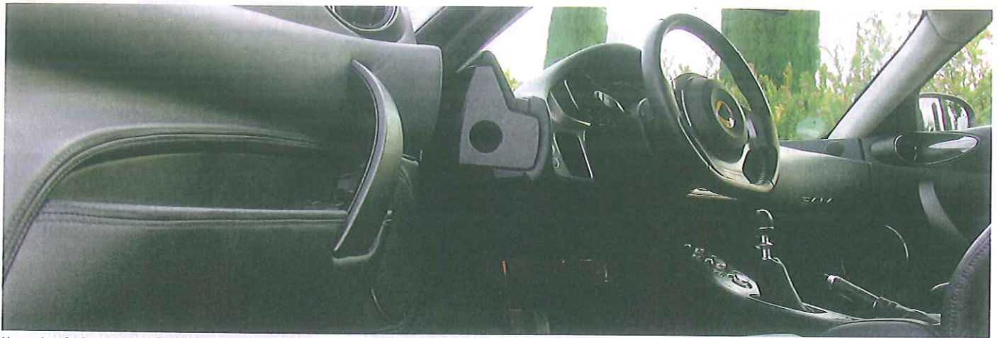
Kann das SuCar-Marketing die Tür zum Kunden öffnen?